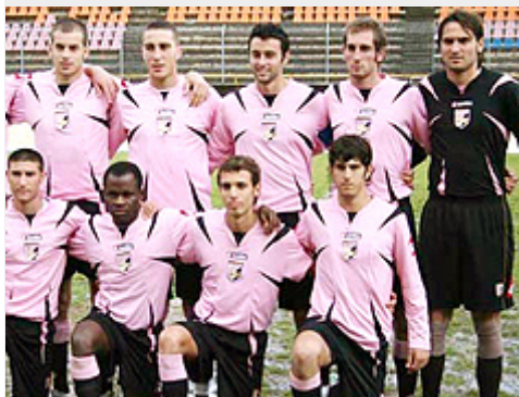
U.S. Palermo (a kapus inverz színekben!)