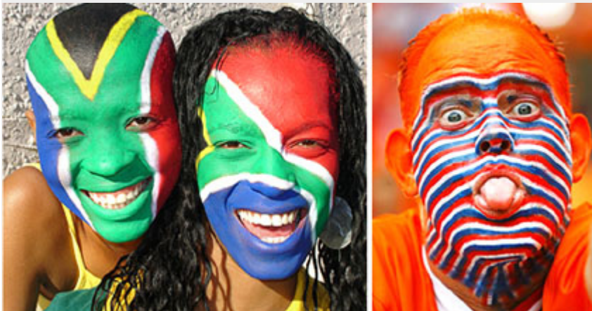
Dél-afrikai és holland szurkolók, a 2010-es futball vb-n