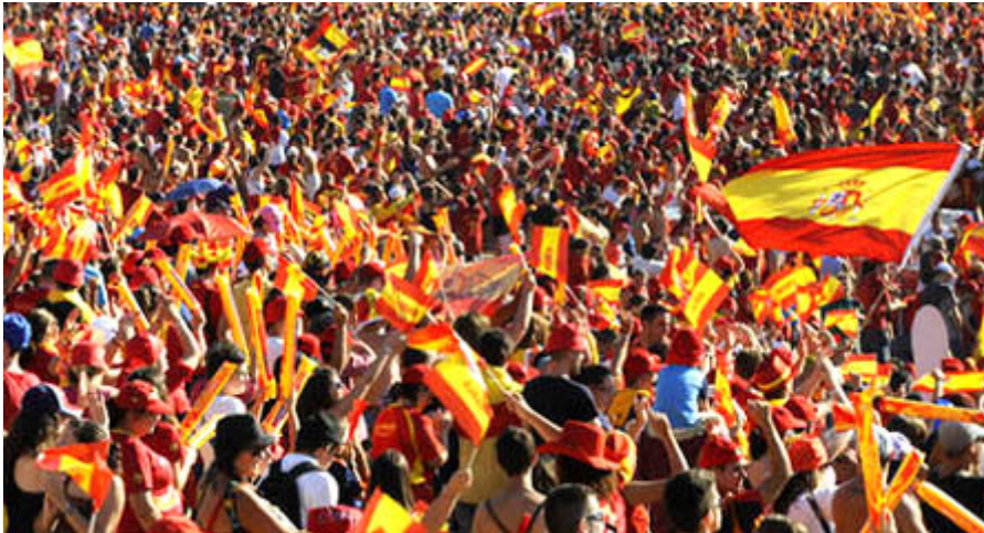
Spanyol zászlóerdő (dél-afrikai futball vb, 2010)