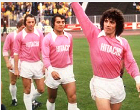
Hamburg S.V. (1980 körül)