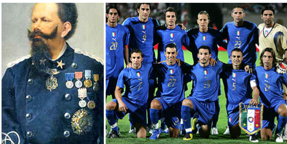
II. Viktor Emanuel király portréja és az olasz válogatott