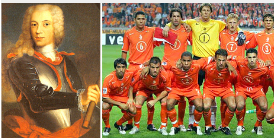
Orániai IV. Vilmos portréja (18.sz. eleje), és a holland válogatott