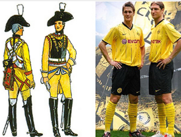
Porosz katonatisztek (18.sz.) és a Borussia Dortmund játékosai (2008)