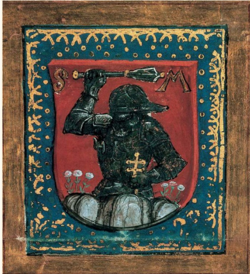
Páncélos vitéz Mátyás fekete seregéből a Márkusfalvi