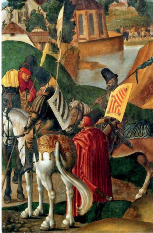
Felvonuló magyar huszások

A mohácsi magyar csatarend legérdekesebb vonása az, hogy szinte pontos tükörképét mutatja a 16. századból ismert török csatarendnek. Az oszmánok híres, félhold alakú csatarendjének tagolódásával szemben a magyarok a lovasság zömével együtt szinte minden, védekezésre alkalmas gyalogos katonájukat is az első harcrendbe állították, míg a király körül, a második vonalban a támadásra vagy inkább ellentámadásra alkalmas nehézlovasság sorakozott fel, amelynek szárnyait kisebb gyalogos- és könnyűlovasegységekkel biztosították. Úgy tűnik, hogy a magyar vezérek seregük adottságainak megfelelő módon, lőfegyvereik tűzerejére is számítva olyan csatarendet alakítottak ki, amelyet kellőképpen rugalmasnak tartottak arra, hogy eredményesen védekezhessenek, ám ha lehetőség adódik, ellentámadásra is képesek legyenek.