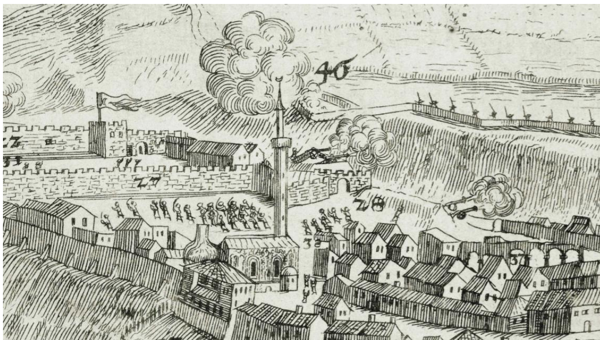
A budai pasák palotája a 17. században (33-as számmal jelölve). Domenico Fontana metszete, 1686

Új palotájuk helyét a visszafoglaló háborúk során készült térképek és látképek alapján pontosan ismerjük: a Színház utcában, a mai Miniszterelnöki Hivatal helyén állt. Minden bizonnyal nem véletlenül esett a választásuk erre a telekre, ugyanis a hódoltság előtt itt állt a város egyik legnagyobb reneszánsz főúri palotája, a Szapolyaiak rezidenciája. 1541-ben, Buda elfoglalásakor Werbőczy István nádor lakott benne, és elképzelhető, hogy a pasák már ekkor megszerezték maguknak az épületet.